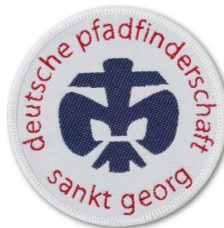
DPSG-Aufnäher rund (2,50 €)