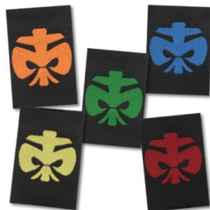
Stufenabzeichen (0,80 €) Gibt es beim Versprechen vom Stamm!