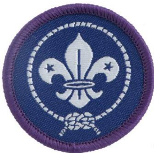
Weltbund-Abzeichen (2,90 €)